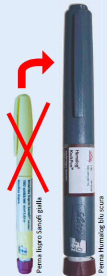
Penna lispro Sanofi gialla