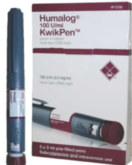
Penna Humalog blu scura