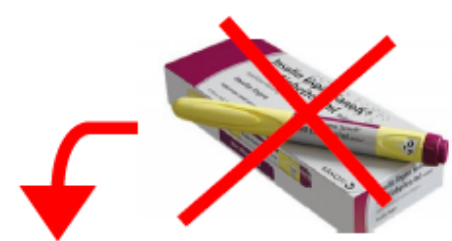
Penna Lispro Sanofi gialla

HANNO LA STESSA QUALITÀ, LA STESSA EFFICACIA E LA STESSA SICUREZZA.